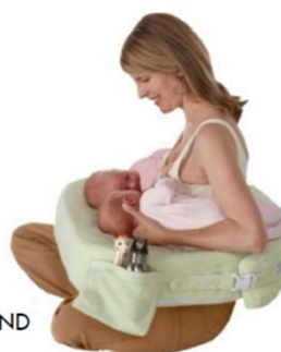
MY BREAST FRIEND